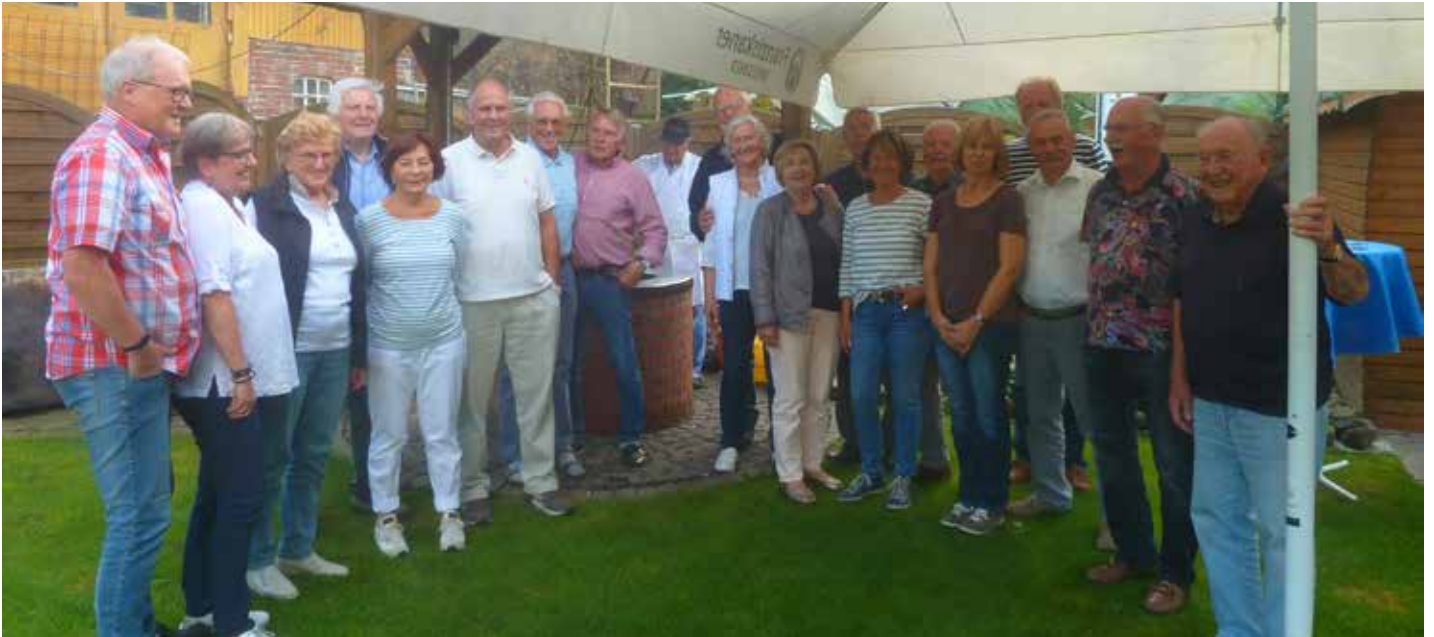
Männer I Gruppe mit Ihren Frauen im Dorfkrug Delfshausen.

Neben dem Freitagssport gibt es viele weitere Aktivitäten der Männer I des VfL Rastede, und dies schon seit vielen Jahren. Als eine der schönsten Aktivitäten, gilt in dem Männerkreis die jährlich stattfindende Radtour mit „Gepäck“ nach Delfshausen. Denn bei näherer Betrachtung stellt sich als das „Gepäck“ die jeweilige Partnerin der Freitatus heraus. „Schön, dass wir die Frauen dabei haben“, wird immer wieder Mal wieder deutlich festgestellt. Ziel der Radtour ist wie jedes Jahr die Gaststätte Decker in Delfshausen. Eigentlich steht ja in Leos Hollsteins Jahresplan „Radtour nach Delfshausen“. Aber aufgrund der unsicheren Wetterverhältnisse hatten sich diesmal lediglich acht Unentwegte mit dem Fahrrad auf den Weg gemacht, die anderen „reisten“ mit dem Auto an. Hauptsache das „Gepäck“ kommt unbeschadet nach Delfshausen. Ja, aber warum gerade Delfshausen, könnten man fragen. Was ist es, das die Gruppe motiviert, gerade dort Station zu machen? Einfach gesagt: Es ist reichlich, vor allem schmackhaft zubereitetes Grillgut nebst wohlschmeckenden Salaten sowie das eine oder andere Bier.