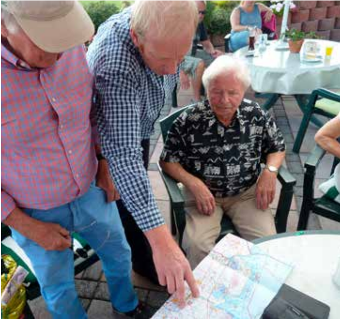
Vor dem Abflug: Festlegung der Flugroute einmal Nordsee und zurück