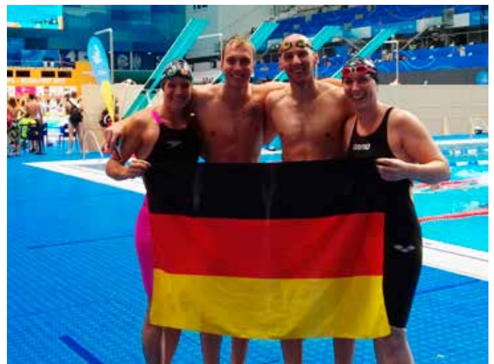
Die 4x50 Lagenstaffel mixed