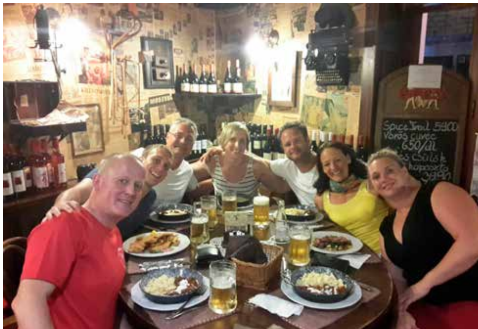
Gut gelaunt genießen – die VfLer in einem typisch ungarischen Restaurant

Egal ob ehemaliger Profi-, Leistungs- oder Hobbyschwimmer, mit einem mussten alle klarkommen: Die eigene Erwartungshaltung und die damit einhergehende Nervosität. Das persönlich Beste unter den Druckbedingungen einer großen Meisterschaft abzurufen und seine Nerven im Griff zu haben, ist an sich genommen schon eine Höchstleistung. Das haben die Rasteder auch im Nachhinein der WM gemerkt. Die intensive Vorbereitung als auch die tägliche psychische Anspannung der