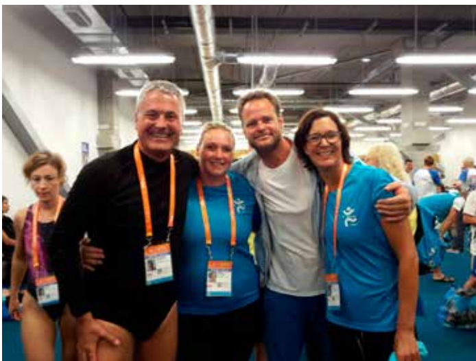
Die 4x50 Freistilstaffel mixed