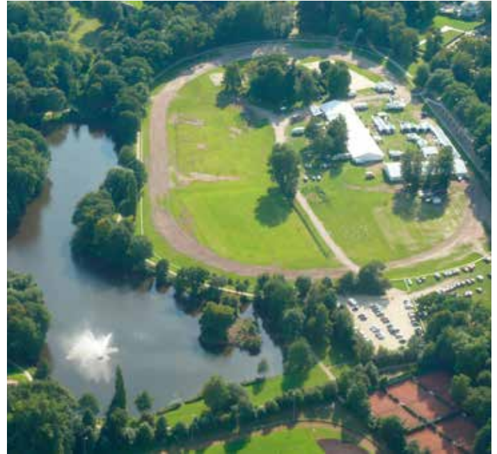
Rastede und seine Umgebung von oben: Ein ganz besonderes Erlebnis

mit einem Rundflug über Rastede und umzu, mit Startpunkt Flugplatz Conneforde? Ist Uwe überhaupt flugtauglich? Eine vertrauliche Anfrage ergab ein deutliches „Ja“ und der Flug konnte starten.