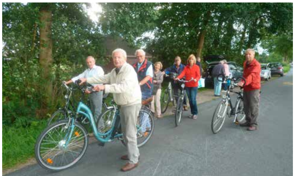
Trotz wechselhaftem Wetter – mit dem Fahrrad nach Delfshausen