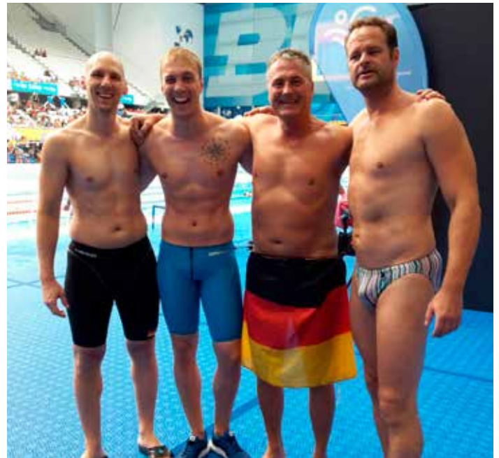
Die 4x50 Freistilstaffel der Männer