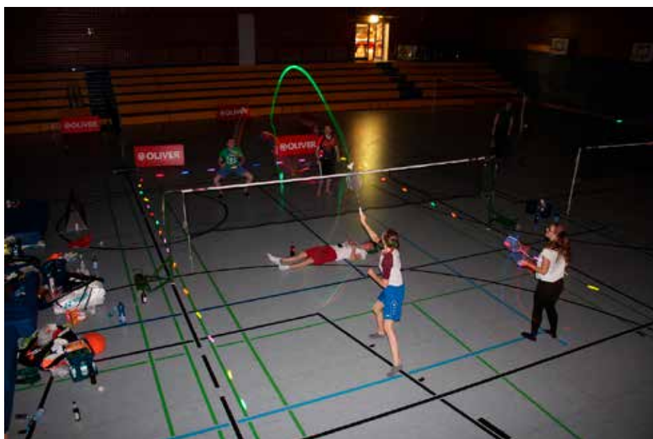
Mit Knicklichtern und LED-Federbällen wurden bis tief in die Nacht Freundschaftsspiele bei völliger Dunkelheit ausgetragen

Wir hoffen, die Teilnehmerzahl in den nächsten Jahren noch steigern zu können, um den Ellerncup zu einer festen Größe für den Badmintonsport in Norddeutschland zu machen. Die tolle schöne Halle an der Feldbreite eignet sich hierfür hervorragend. Einen herz-