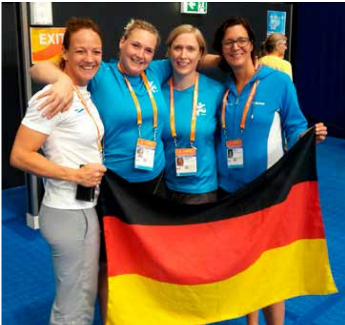
Die 4x50 Freistilstaffel der Frauen

nik seiner Startsprünge mit den ungewohnten Absprunghilfen (schräge Abdruckplatte für den Schrittstart bzw. Starthilfe beim Rückenstart) zu verfeinern, konnte in den sog. Fanzonen die Siegerehrungen verfolgen. Die Deutschen Schwimmer (ca. 600) standen dabei mehrmals auf dem Treppchen und holten sogar einen Weltrekord. Mit der Medaillenvergabe hatten die Rasteder Schwimmer zwar nichts zu tun, waren trotzdem mehr als glücklich an solch einem Event teilnehmen zu können. Es ist an sich schon eine besondere Ehre, im dem Becken zu schwimmen in dem z.B. auch die ungarische Starschwimmerin Katinka Hosszú oder ehemalige Kader-