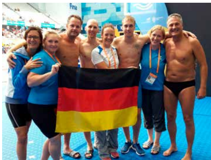
Das Team des VfL Rastede in Budapest