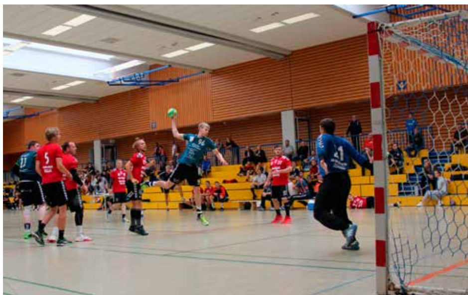
Die Erste Herrenmannschaft Rastede zeigte eine ausgesprochen starke Turnierleistung.